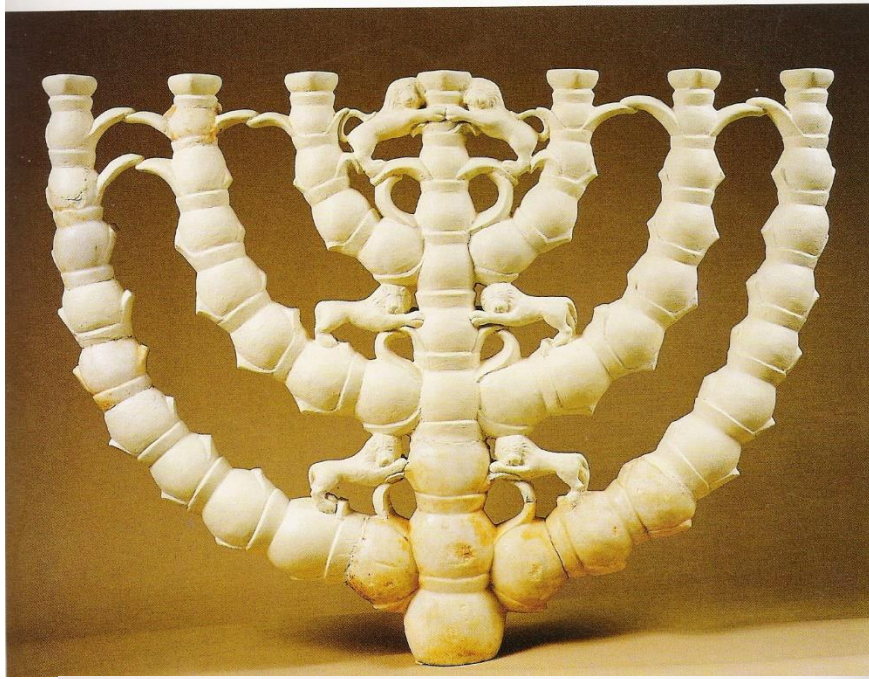
שחזור מנורת בית הכנסת במעון (נירים)