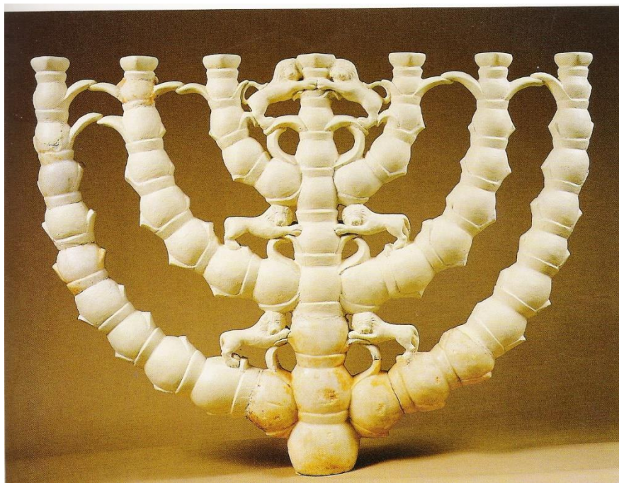
שחזור מנורת בית הכנסת במעון (נירים)